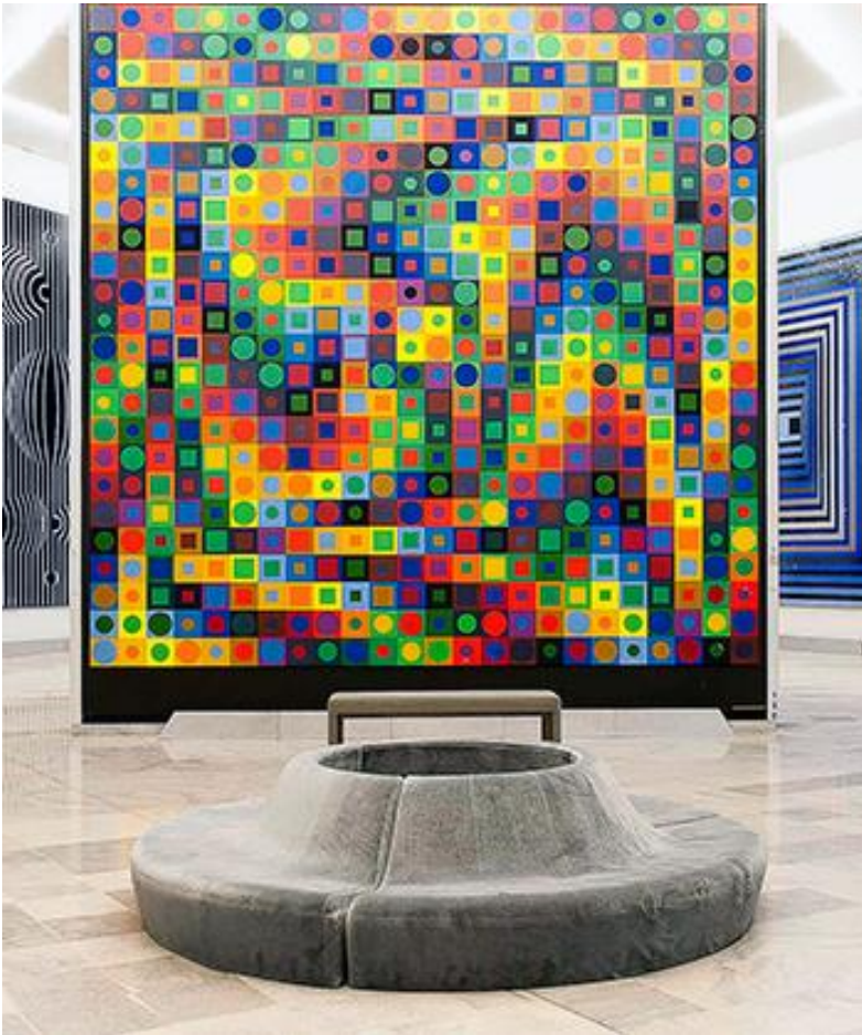
Victor Vasarely, Majus (1964 – 1975), papiers collés